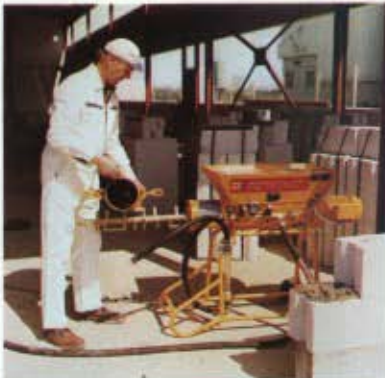
Le nettoyage de l'ESTROMAT 404 est d'une extrême simplicité: asperger d'eau le tube et l'arbre de malaxage et c'est fini.