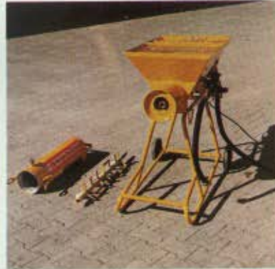
Quelques gestes suffisent pour démonter la machine en quatre pièces (tube de gâchage, arbre de malaxage, châssis, trémie).