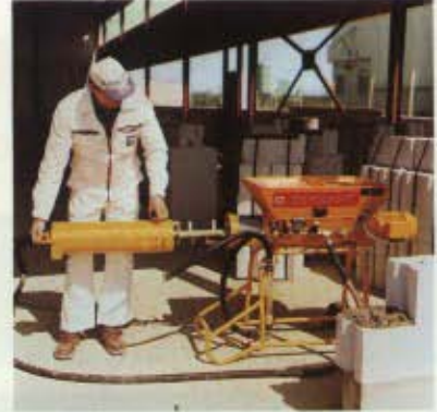
Le déblocage des deux fermetures excentriques permet d'enlever facilement le tube de gâchage et l'arbre de malaxage.