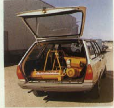
Du fait de sa démontabilité, l'ESTROMAT 404 est facile à charger dans une voiture tout en laissant de la place pour l'outillage.

L'ESTROMAT 404 est une machine à gâcher en continu les mortiers secs prêts à l'emploi. A la pression sur un bouton il fournit un mortier parfait dans une consistance régulière et au débit voulu.