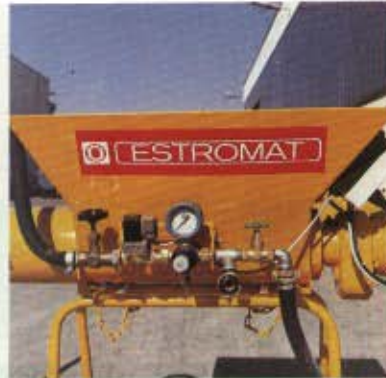
La rampe d'eau, à portée de main, pourvoit avec précision à la régularité de la consistance du mortier.