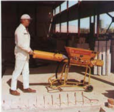
Sur chantier la machine est aussi facile à déplacer qu'une brouette.