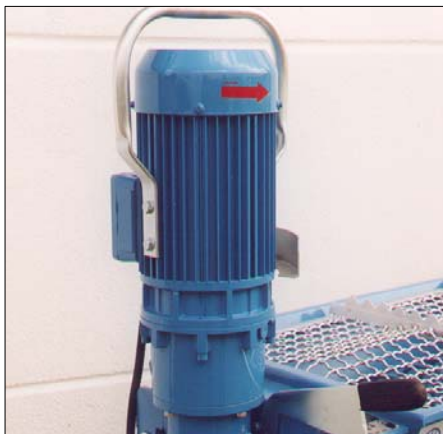
Leichter und kleiner 5,5 kW Pumpenmotor mit Schutzbügel.