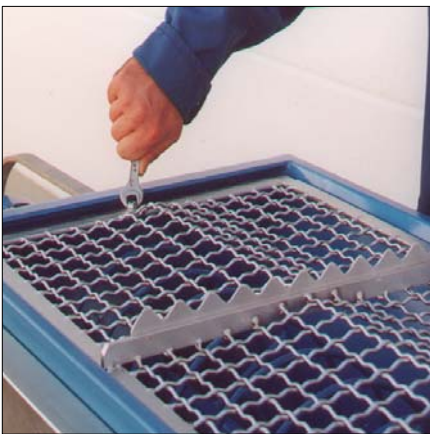
Integrierter Sackaufreißer auf dem Sieb