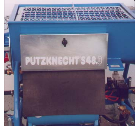
Leicht zugänglicher Werkzeugkasten: Platz für Bordwerkzeug und kleineres Zubehör.