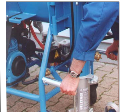
4 Praktische Tragegriffe erleichtern den Transport der Maschine