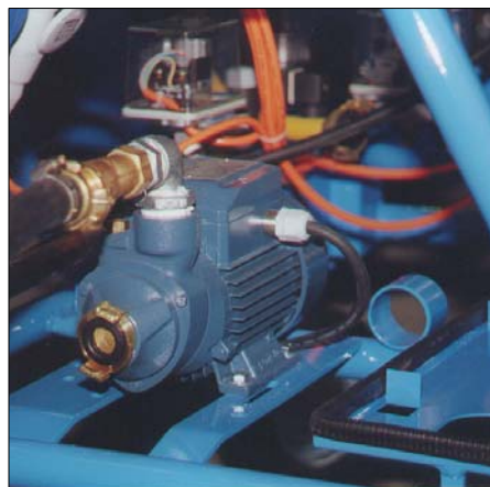
Druckerhöhungspumpe mit automatischer Abschaltung während Arbeitspausen.

für den klassischen Stukkateurbetrieb, aber auch für den Beton Sanierer und