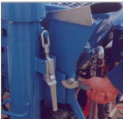
Leicht nach spannbarer Keilverschluss zum Schließen der Mischkammer

Neben den bewährten Merkmalen, wie leichte, aber robuste Bauweise, einfache Handhabung, außergewöhnliche Zuverlässigkeit und Servicefreundlichkeit, haben unsere Ingenieure Erkenntnisse aus der Praxis und wertvolle Anregung unserer Kunden aufgenommen.