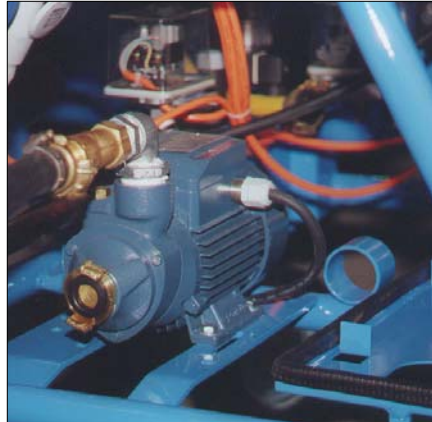
Wasser-druckerhöhungspumpe Zur Befestigung am Maschinenrahmen.