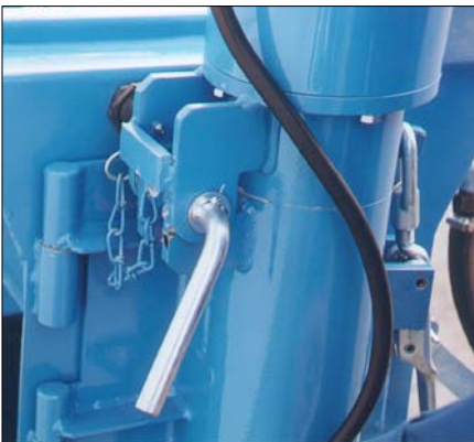
Pumpenmotor ohne Werkzeug zum Transport leicht abnehmbar.