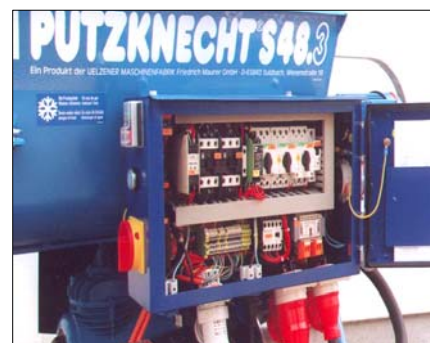
Verbesserte Elektrische Steuerung mit Drehrichtungsautomatik und Wiedereinschaltperre

Renovierer, den Fliesenleger, Fließestrichleger und Sonderanwender.