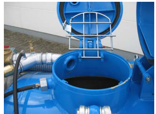
Sicherheits-Sieb im Kesseldom